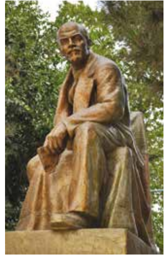
Lietuvoje jau pamirštas vaizdas...

Didžiulė staigmena manęs laukė astronomijos stovykloje, į kurią buvo susirinkę 15-mečiai paaugliai. Mąščiau apie tai, kaip aš galėčiau būti Dievo karalystės liudytoju vaikams musulmonams. Supratau, kad ne kitaip, kaip tik per tikrą ir nesavanaudį gerumą, nuoširdumą ir atvirumą. Jaučiau, kad to pakaks. Prisiminiau, kad vienas misionierius