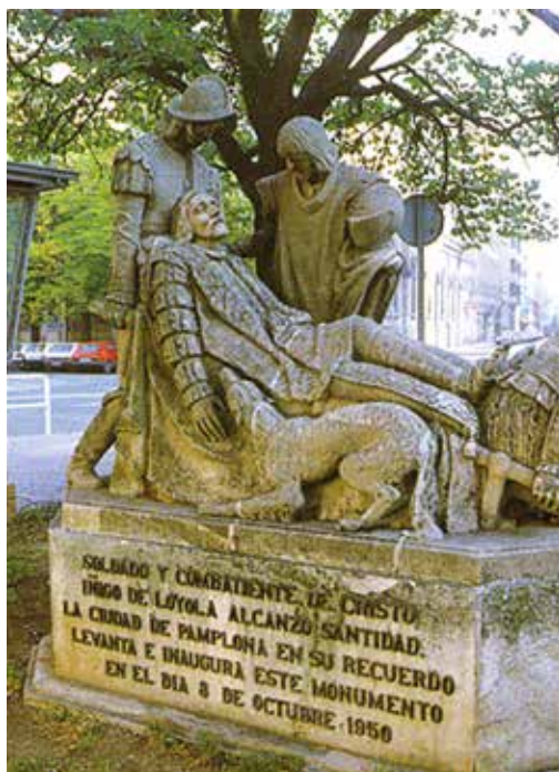
Paminklas šv. Ignacui Pamplonoje

Arba dar vienas malonus susitikimas Igualdaje. Tai nemažas, Marijampolės dydžio, miestas, įsikūręs dienos kelio atstumu nuo Monserato vienuolyno. Jau ankstesnė patirtis mums kuždėjo, kad didesniame mieste susirasti nemokamą nakvynę ar maisto bus sunku. Nepavykus susitarti kitur, keliavome į senelių namus, kur susitikome dvi nepažįstamas damas. Viena iš jų mane užkalbino... ir po pusvalandžio jau riedėjome jos automobilyje namų link. Buvo labai įdomu kalbėtis su žmogumi nemokant ispaniškai... Bet eilinių kartą supratau, kad tokiais ir panašiais atvejais prasideda pati suprantamiausia žmogiskumo