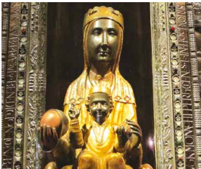
Juodoji Monserato Madona

Azpeitijos apylinkėse įsikūrusi Lojola mus pasitiko vasarišku oru. Praleidome čia kelias dienas. Azpeitijos ligoninėje paskutinį kartą po studijų Paryžiuje sugrįžęs į savo tėviškę darbovosį šv. Ignacas. Čia jis 1535 m., atsisakęs tėvų dvaro prabangos, slaugė ir gydė ligonius, evangelizavo miestelio žmones, ragino atsisakyti nedorų papročių. Toliau mūsų kelias vedė į Pamploną, kur mūsų šv. Ignacas buvo sužeistas ir pradėjo savo atsivertimo kelionę. Vėliau aplankėme