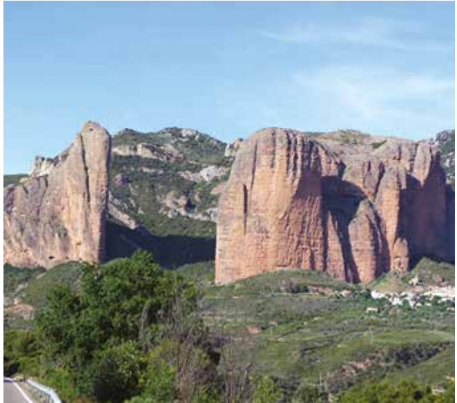
Nuostabūs Riglos kalnai

O koks buvo pats didžiausias iššūkis? Turbūt karštis. Perėjus Pirėnų prieigas, o vėliau pasiekus Kataloniją, keliauti vidudienį buvo neįmanoma. Kai kada karštis siekdavo +42 laipsnius. Tada griūdavome pavėsyje, pildavome vandenį ant galvų ar čiulpdavome vieno mūsų broliuko dar Birminghame dovanotas mėtinės tabletės, vis tiek mintyse dėkodami visiems sutiktiems geradariams, kurie mus vienaip ar kitaip palaikė.