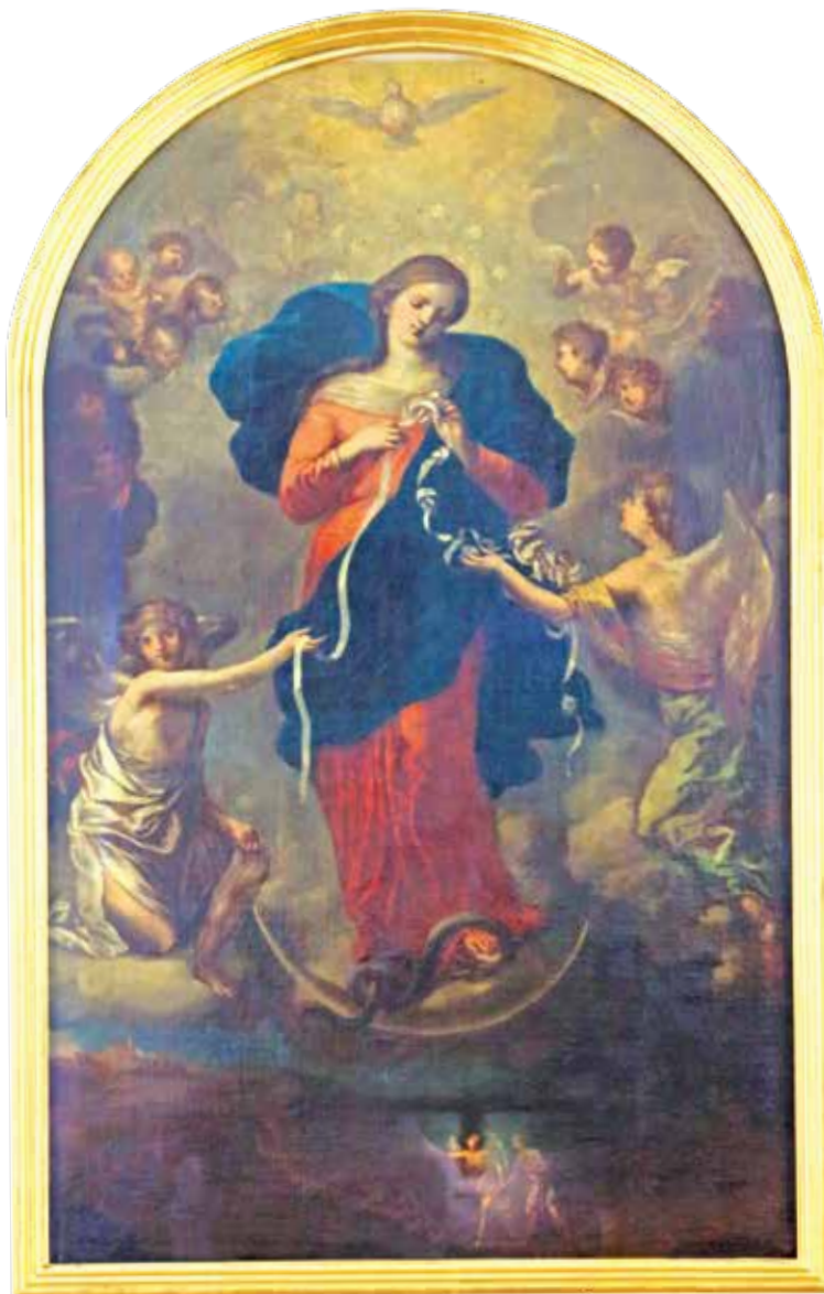
Švč. Mergelė Marija, atrišanti mazgus. Augsburgio šv. Petro bažnyčios šoninio altoriaus paveikslas (1700 m.)

Švenčiausioji Marija, Jėzaus ir mūsų Motina, tu žinai, kad mūsų gyvenime yra daugybė didelių ir mažų mazgų. Mes jaučiamės prislėgti, prispausti mūsų problemų ir nepajėgūs jas išspręsti. Pasitikime tavimi, Taikos ir Gailestingumo Motina. Marija, neleisk mums patekti į piktojo pagundą, išlaisvink iš kiekvienos vergystės, priklausomybės, sumaišties ir nesaugumo. Suteik savo malonę ir šviesą, kad galėtume matyti mus supančiose tamsybėse ir eiti teisingu keliu.