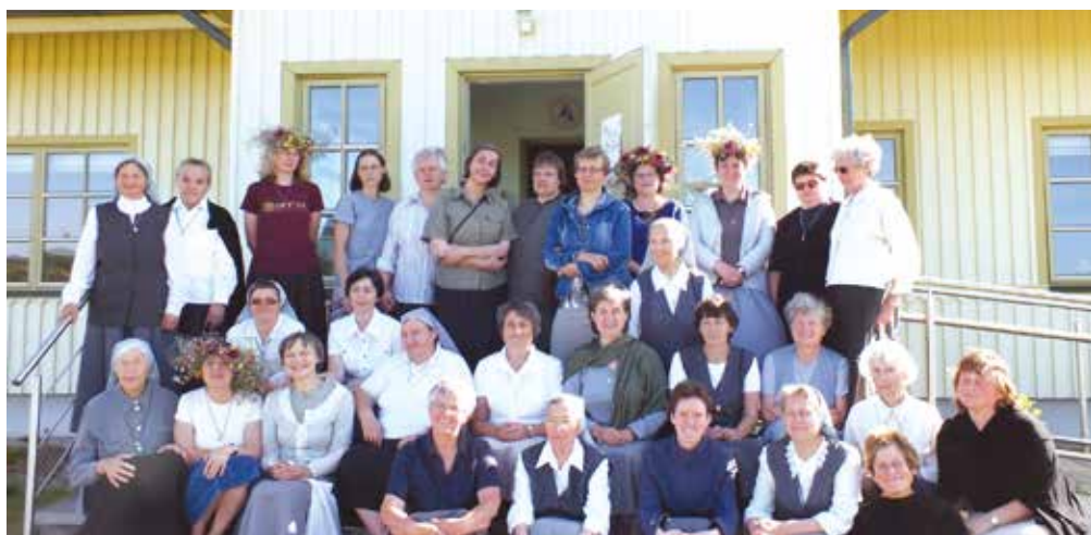
Seserų susitikimas vasarą Guronyse

ir ugdyti studijuojantį jaunimą bei burti katalikišką inteligentiją. Iš mažų butukų, tokių kaip anuomet Žirmūnuose priglaudęs mane, pirmųjų medicinos kursų studentę, seserys pasklisdavo po parapijas, vedė minias į Kryžių kalną, įvairiai užsimaskavusios keliavo į misijas Armėnijoje, Gruzijoje, Kazachstane, Moldovoje ir kitur. Ne viena traukė ne tik už sienos, bet ir prie sienos – į atokiausiuose Lietuvos kampeliuose tūnančias trobeles uždangstytais langais, kur paromis, kol nesusekė, buvo spausdinama Lietuvos Katalikų Bažnyčios Kronika. Šis tikėjimo, pasipriešinimo melui, laisvės ir vilties žiburys vėliau buvo platinamas tęsiant slaptas keliones, kuriose seserys seklius pergudraudavo net pasidabinusios perukais ir išverčiamais drabužiais.