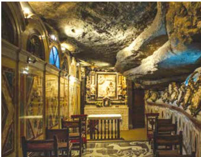
Manrezos ola, kurioje gyveno ir Dvasines pratybas parašė šv. Ignacas Lojola

Labiausiai mane pakrerėjo dienos žygis Monserato kalnu į benediktinų vienuolyną. Nors kulminacija galėčiau pavadinti ir Manrežą – čia kiekviena gatvė primena Ignacą, jo atsidavusią tarnybą Dievui ir žmonėms. Bet net ir gyvendamas Manrezos oloje ir rašydamas Dvasines pratybas, jis žiūrėjo į Monserato pusę, kur ypač garbinamas Jėzus ir mylima jo Motina Marija. Čia Ignacas galutinai apsisprendė eiti nauju gyvenimo keliu, atliko gyvenimo išpažintį, paliko savo ginklus ir drabužį. Šį įvykį menantys ženklai ir nuostabūs