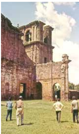
Šv. Mykolo Arkangelo redukcijos liekanos Pietų Brazilijoje