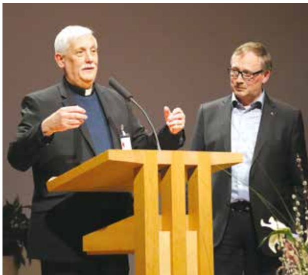
Penkių Europos provincijų simpoziume Vokietijoje dalyvavo ir Draugijos generolinis vyresnysis t. Arturo Sosa (kairėje)

Draugijos generolas nusprendė, kad 5 provincijos turi susitarti ir organizuoti bendrą ugdymą. Tai nereiškia, kad viskas baigsis vienos provincijos sukūrimu. Kol kas apie tai kalbėti gerokai per anksti.