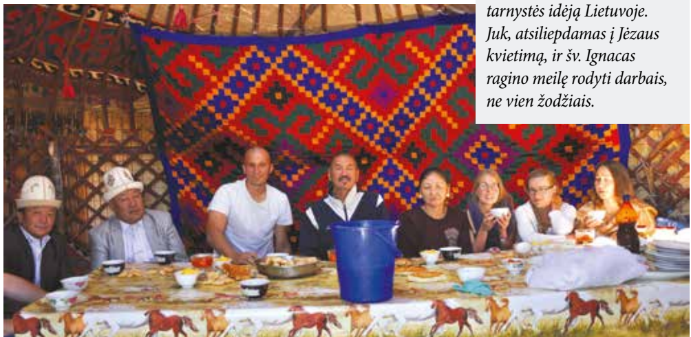
Svečiuose pas vietos gyventojus

2016 m. Asyžiuje susirinkusius visų tautų ir religijų atstovus popiežius Pranciškus pakvietė: