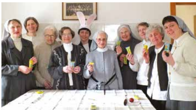
Antrąją Velykų dieną Kaune